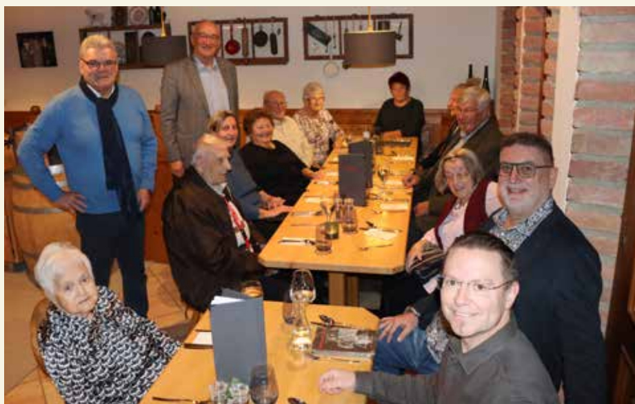
Jubilarfeier: Die Gemeinde ehrte ihre Geburtstagskinder im Weinbistro Pinotheque im Weingut Hartl.